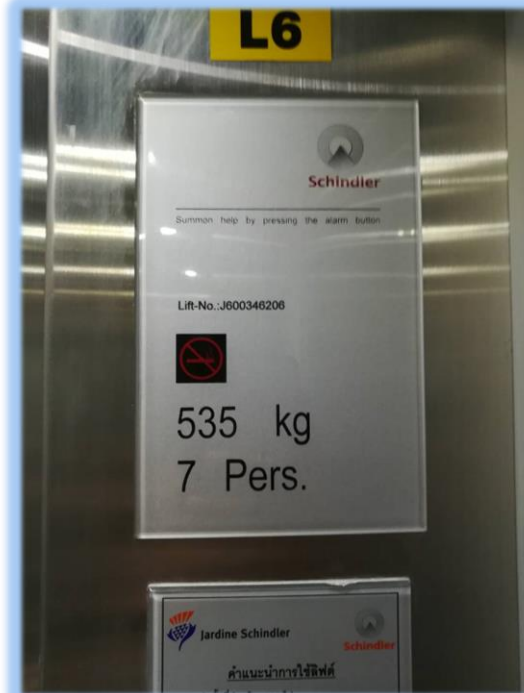
ภาพที่ 2-2 บ้ายให้คำแนะนำการใช้อุปกรณ์