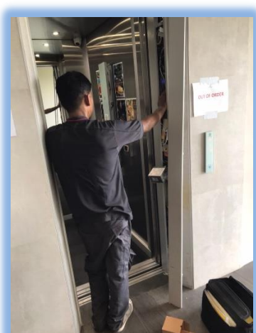
ภาพที่ 2-7 เจ้าหน้าที่ซ่อมบำรุงลิฟ