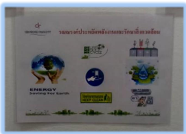
ภาพที่ 2-6 ป้ายรณรงค์ประหยัดน้ำ