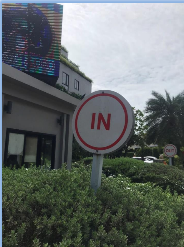
ภาพที่ 2-10 ป้ายบอกทางเข้าออกโครงการ