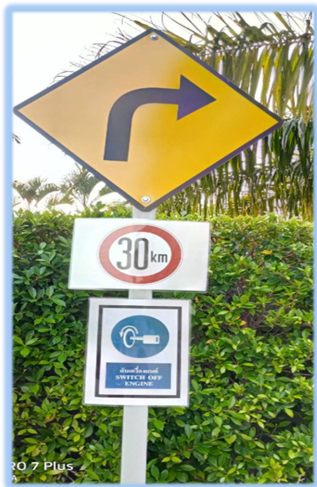
ภาพที่ 2-4 ป้ายดับเครื่องยนต์ขณะจอดรถ