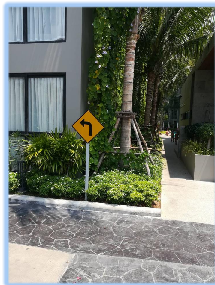
ภาพที่ 2-5 ป้ายจราจรรอบโครงการ