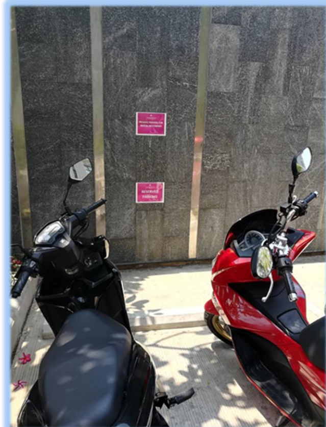
ภาพที่ 2-11 ป้ายแนะนำการจอดรถ