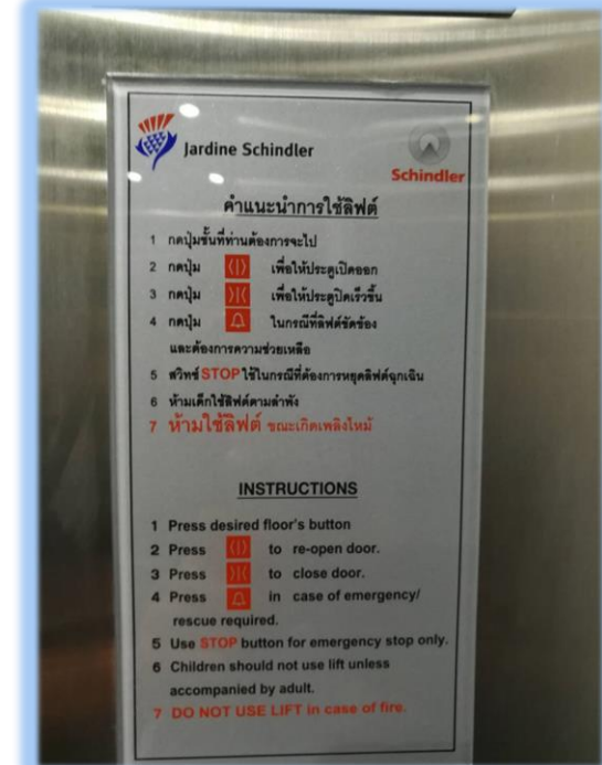
ภาพที่ 2-3 บ้ายให้คำแนะนำการใช้อุปกรณ์