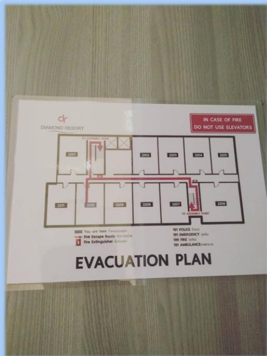
ภาพที่ 2-1 บ้ายบอกทางหนีไฟ