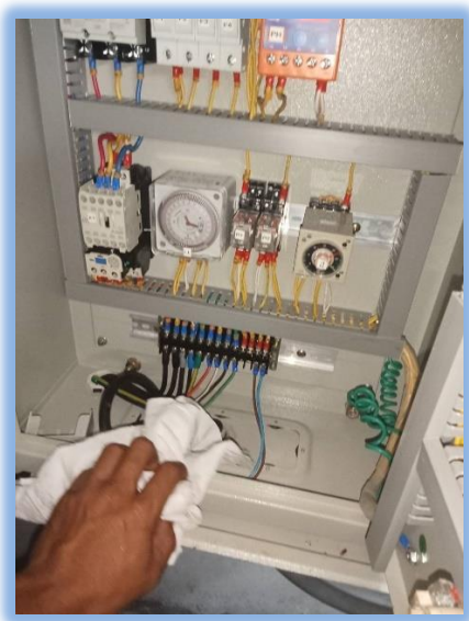
ภาพที่ 2-8 การบำรุงดูแลรักษาระบบแสงสว่างรอบอาคาร