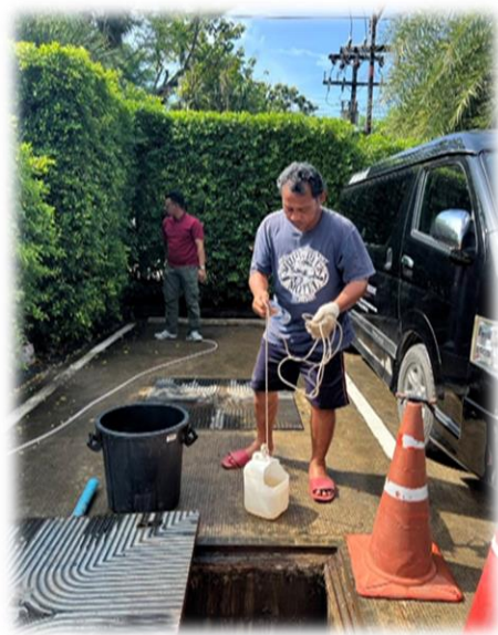
ภาพที่ 2-9 การบำรุงดูแลรักษาและตรวจสอบคุณภาพน้ำ